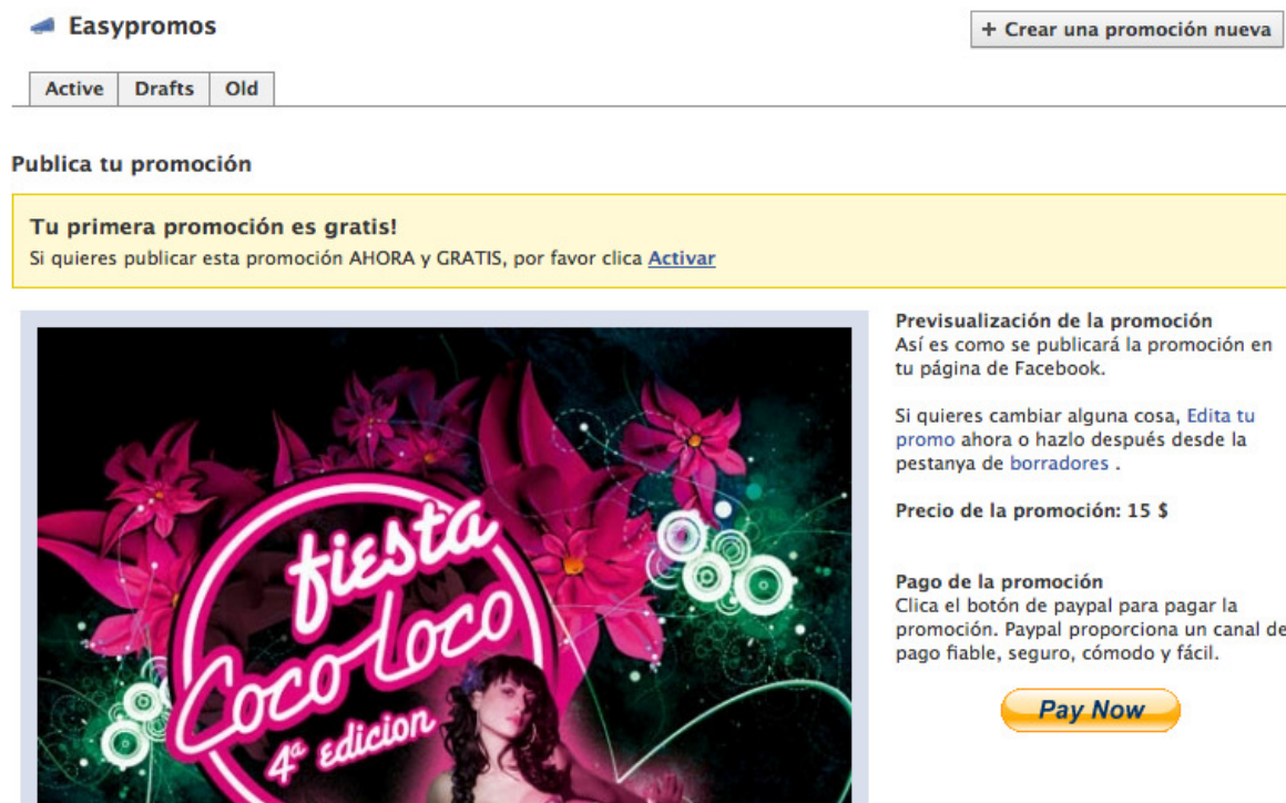
Imagen 8: La primera promoción que se activa es gratis. Se notifica mediante esta notificación amarilla en la pantalla de previsualización y pago.

Cualquier promoción que esté activa o en la carpeta de borradores, se podrá acceder para modificarla, eliminarla, o publicarla/despublicarla.