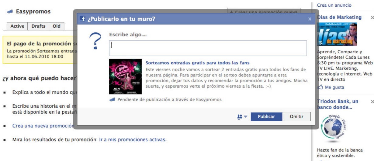
Imagen 9: Promociona la nueva promo una vez se ha activado. Esta historia se publicará en el muro de la página.

Una vez publicada la promoción, Easypromos te muestra manera de cómo promocionar la propia promo: Publicándola en el muro de tu página de Facebook para que se enteren inmediatamente los fans [ver imagen 9]