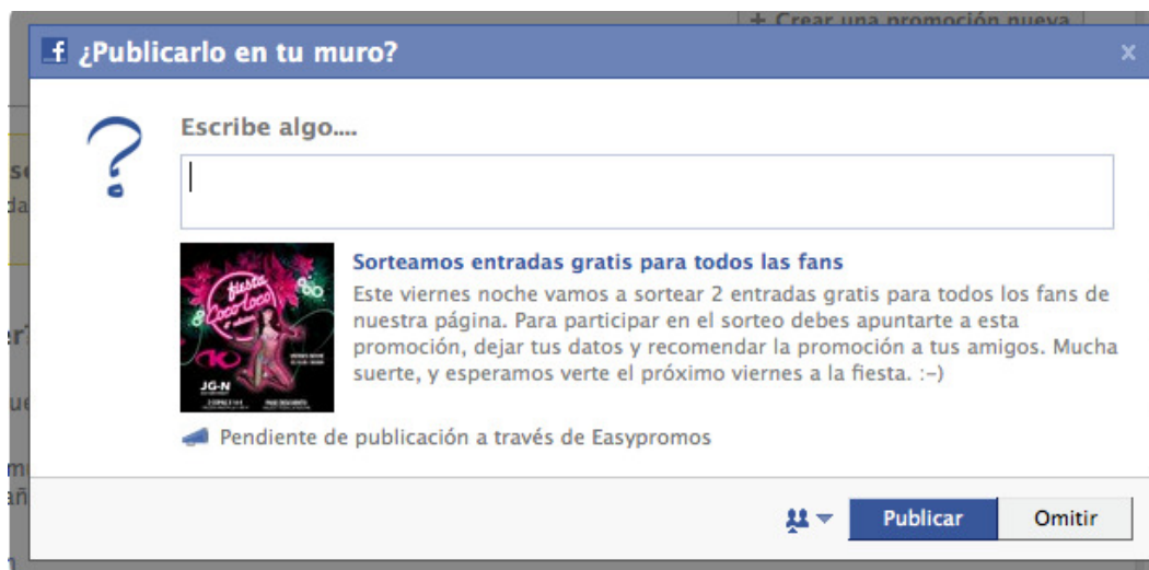
Imagen 4: el usuario podrá publicar su historia en su muro y podrá enviar recomendaciones a sus amigos, una vez completado el formulario de registro.

Una vez el usuario ha rellenado el formulario, automáticamente se le redirige a una pantalla final para que de a conocer la promoción a sus amigos [ver imagen 4]. ¿Cómo? Publicando una historia en su muro y enviando recomendaciones a sus amigos . El administrador de la promoción podrá conocer cuantas recomendaciones han enviado los usuarios inscritos .